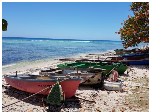
Botes de remo para pescar

En el municipio Ciénaga de Zapata, la zona costera al sur de Matanzas, existe una arraigada tradición de pesca en la plataforma marina con embarcaciones propias a remo. Al ser Cuba una isla, la pesca tiene la posibilidad de constituir una de las principales fuentes de alimento. Sin embargo, las bases de pesca no disponían los materiales necesarios y las estructuras se encontraban en malas condiciones, lo que impedía las actividades pesqueras.