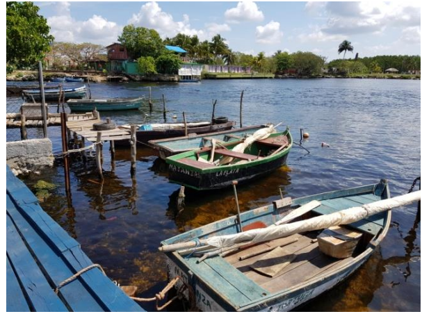
Muelle y embarcaciones