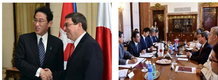
Reunión de Cancilleres Cuba-Japón

(i) El Canciller Kishida expresó su satisfacción por encontrarse nuevamente con el Canciller Rodríguez. Formuló el deseo de elevar las relaciones Cuba-Japón a un nuevo nivel y, con este objetivo, anunció que se iniciará una donación a gran escala a Cuba, además de proponer la creación de una comisión mixta en el sector público empresarial para fortalecer las relaciones económicas, y la creación de “Consultas Cuba-Japón sobre cuestiones relacionadas con la ONU” para realzar el diálogo sobre diferentes cuestiones internacionales.