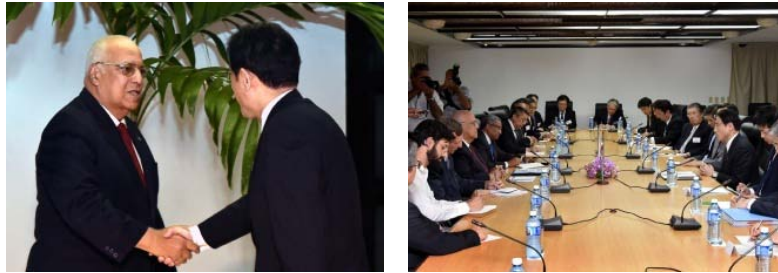
Reunión con el Excmo. Sr. Ricardo Cabrisas Ruiz, Vicepresidente del Consejo de Ministros

(i) Expresando su deseo de fortalecer las relaciones económicas entre los dos países, el Canciller Kishida subrayó la importancia de mejorar el ambiente de negocios en Cuba, y el interés en la Zona Especial de Desarrollo Mariel y la nueva Ley de Inversión Extranjera. El Canciller Kishida también explicó que se iniciará una donación a gran escala y que se había propuesto la creación de una comisión mixta en el sector público empresarial.