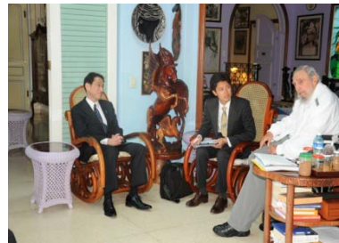
Visita de cortesía al Excmo. Sr. Fidel Castro Ruz, ex Presidente de los Consejos de Estado y de Ministros

(i) El Canciller Kishida expresó su satisfacción por ser el primer canciller japonés en visitar Cuba, y transmitió al Presidente Raúl Castro que en su encuentro con el Canciller Rodríguez se había acordado que Cuba y Japón fortalecerán el diálogo y la cooperación para elevar las relaciones bilaterales a un nuevo nivel.