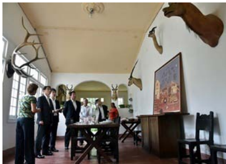
Casa de Hemingway

Ofrenda floral ante el Memorial José Martí; Reunión de Cancilleres Cuba-Japón; Almuerzo ofrecido por el Excmo. Sr. Bruno Rodríguez Parrilla, Ministro de Relaciones Exteriores; Reunión con el Excmo. Sr. Ricardo Cabrisas Ruiz, Vicepresidente del Consejo de Ministros (a la que también asistieron representantes empresariales); Visita de cortesía al Excmo. Sr. Raúl Castro Ruz, Presidente de los Consejos de Estado y de Ministros; Visita de cortesía al Excmo. Sr. Fidel Castro Ruz, ex Presidente de los Consejos de Estado y de Ministros