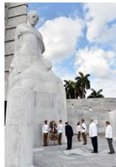
Ofrenda floral ante el Memorial José Martí