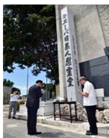
Memorial a los cubanos descendientes de japoneses

El Canciller Kishida visitó el Memorial a los cubanos descendientes de japoneses y también visitó la Habana Vieja, uno de los sitios turísticos preeminentes de Cuba, declarado Patrimonio Mundial de la UNESCO.